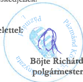
Böjte Richárd polgármester